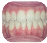
Vista frontale dopo il trattamento