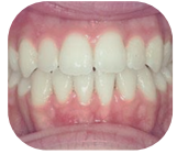
Frontal view after treatment