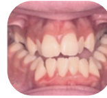
Μπροστινή όψη πριν από τη θεραπεία

Μόλις επιτευχθεί η επιθυμητή διαστολή, ο χειρουργός θα μπλοκάρει το TPD ώστε να μην μπορεί να στενέψει ή να διευρυνθεί. Το TPD θα παραμείνει στη θέση του για 4 έως 6 μήνες. Μετά την περίοδο αυτή, και όταν η TPD δεν είναι πλέον απαραίτητη για την ορθοδοντική θεραπεία, ο χειρουργός θα αφαιρέσει την TPD.