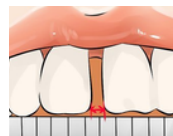
separación entre incisivos

El ensanchamiento del TPD utilizando la llave del paciente durará unas semanas, dependiendo de cuánto ensanchamiento sea necesario. Durante el proceso de ensanchamiento, habrá un espacio cada vez mayor entre los incisivos medios. Esto se corregirá con el tiempo mediante un tratamiento de ortodoncia. Tenga en cuenta que este espacio se ensancha cada día.