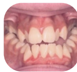
Vista frontal antes del tratamiento

Una vez conseguida la expansión deseada, el cirujano bloqueará el TPD para que no pueda estrecharse ni ensancharse más. El TPD permanecerá en su sitio de 4 a 6 meses. Tras este periodo, y cuando el TPD ya no sea necesario para el tratamiento de ortodoncia, el cirujano retirará el TPD.